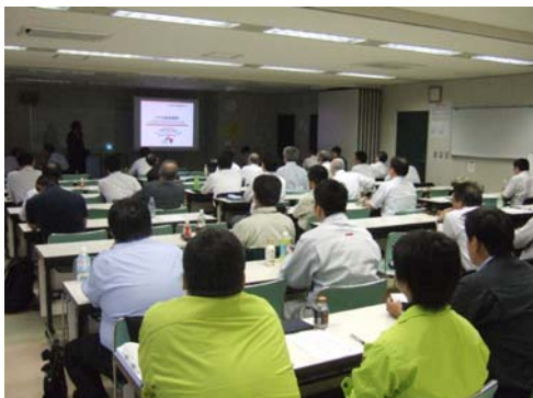
写真-6 地下空間維持管理セミナー開催状況(札幌)