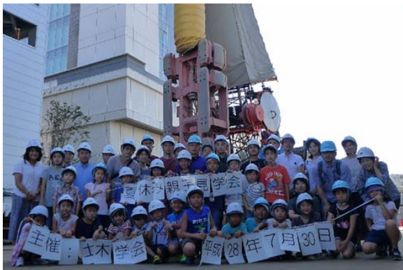
写真2 親子見学会 全体集合写真