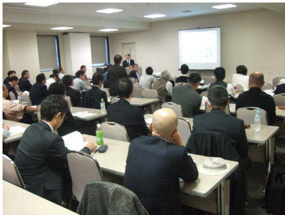
写真9 京都大学研究集会実施状況

今回の研究集会は防災小委員会と京都大学防災研究所と共催で実施したもので、地下空間の水害時の危険性、浸水時の人間の避難行動、地下空間の整備・管理の方法等に関する最近の研究成果についていくつか話題提供をいただき、それらをもとに今後取り組むべき課題やその解決策について総合的な議論を展開した。