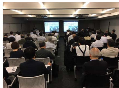
写真-8 人にやさしい地下空間セミナー開催状況(東京)