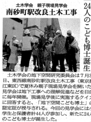
土木学会の地下空間研究委員会は7月30日、東西線南砂町駅改良土木工事（東京都江東区）で夏休み親子現場見学会を開いた。見学会は地下工事への理解促進などを目的に毎年開催。現場見学後に実施するクイズに回答すると、「地下空間こども博士」の認定証が授与される。今回の見学会には小学生と保護者計44人が参加し、新たに24人のこども博士が誕生した。