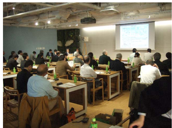
写真10 東京駅周辺地下空間見学会状況（事前説明）

見学会には先に述べたNHK「時論公論」を担当する松本解説委員も参加し、放映の基礎資料とするなど、非常に意義ある見学会となった。