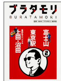
写真4 ブラタモリ

昨年度放映されたNHK番組「ブラタモリ スペシャル 東京駅～巨大地下空間は歴史の生き証人!?～」に地下研が主体となり協力したが、今年度この番組が角川書店から書籍化されるに伴い、再度書籍化への協力を行った。