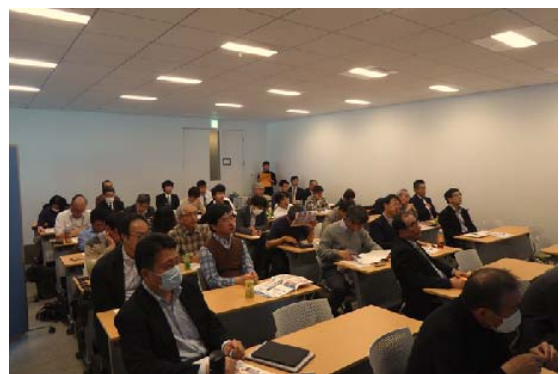
写真-7 防災・減災セミナー開催状況(大阪)