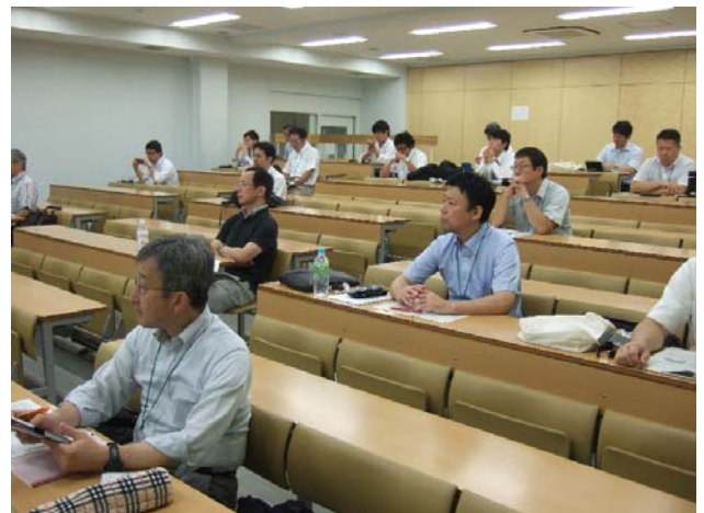
写真-1 全国大会 共通セッション実施状況